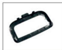
Насадка для чистки ковров